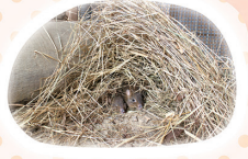
↑フサオネズミカンガルーの巣

オオカンガルーやシマオイワラビー、ケナガワラビーは、「薄明薄暮性」で明け方や夕暮れに活動し、昼間は休息します。曇りの日は活発な日もあり、異なる姿が見られるかも。食べ物は草や木の皮です。フサオネズミカンガルーは夜行性です。藁などをしぼって器用に集めてドーム状の巣をつくります。食べ物は種や菌類です。