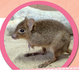
フサオネズミカンガルー

見た目はネズミですが、カンガルーの仲間です。種や菌類を食べ、その排泄物が森を豊かにしています。